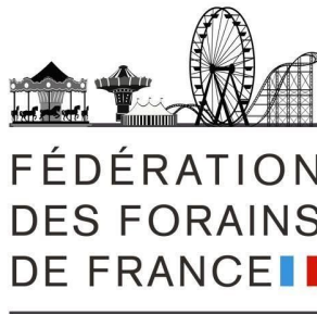
Fédération des Forains de France Nicolas LEMAY