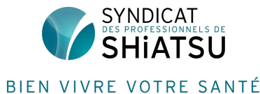
Syndicat des Professionnels de Shiatsu Jacques LAURENT