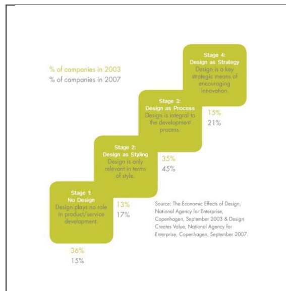
Danish Design Ladder

L'objectif premier de la PND à cet égard est de « faire sauter le pas » à des entrepreneurs qui n'auraient jamais intégré le design dans leur offre de produits et services et, en quelque sorte, de sécuriser ce premier recours (passage du niveau 1 au niveau 3 – ci-dessous –).