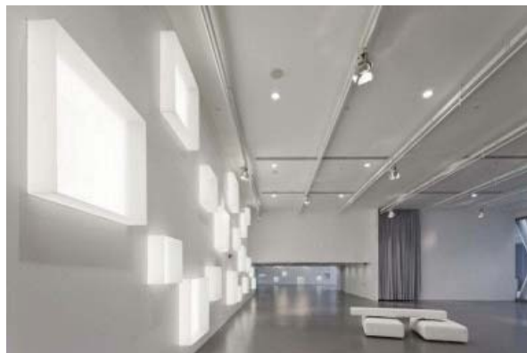
Un exemple d'ambition affichée : le Centre de design de Hong-Kong